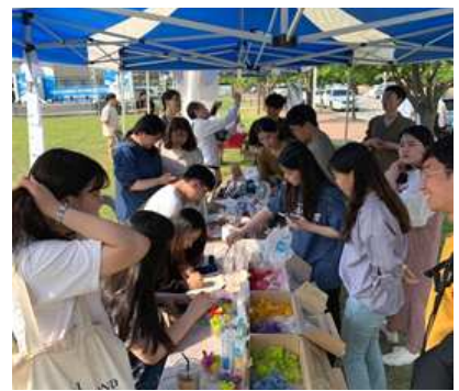
에코리더 활동 장면